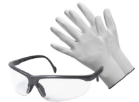
Gants et lunettes de protection